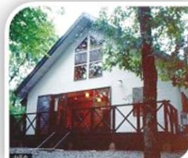
14名棟（山百合）の外観