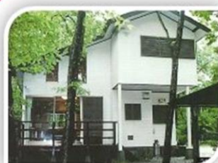
6名棟（しゃくなげ・りんどう・ かっこう・うぐいす）の外観

各棟には、調理器具（炊飯器・電子レンジ等）・ 自炊用具（食器類・鍋・やかん等）・風呂・トイレ・ キッチン・屋根付パーベキュー炉・暖房・冷蔵庫・ テレビ・Wi-Fi・駐車場を、共用で、洗濯機・乾燥機・ パーベキュー用具（網・鉄板）を完備しております。